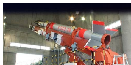
図 3 観測ロケット S-520

超低軌道開発や大気吸入型イオンエンジンでは高層大気密度が極めて重要です。中性高層大気密度はリモートセンシングが困難なので計測器を衛星やロケットに搭載して「その場観測」することが要求されます。本研究グループでは 2022 年度に打上げ予定の S-520 ロケット (図 3) に独自のセンサーを搭載すべく JAXA と共同で開発を行っています。